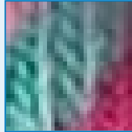
Pixelbild, stark vergrößert